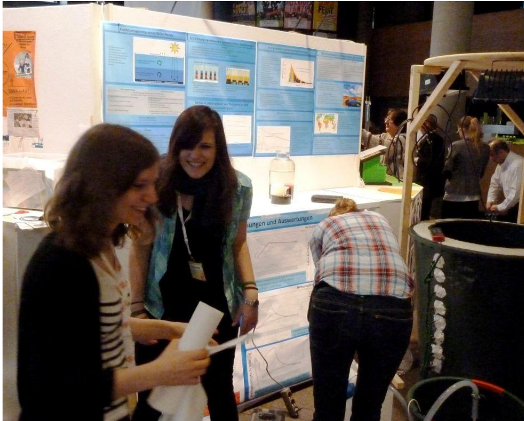
Der Solar-Pond – Stand